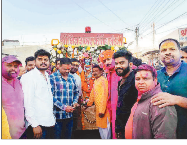
बारात में शामिल लोग।