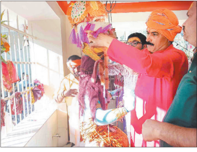
भगवान शिव का श्रृंगार करते समिति के पदाधिकारी।