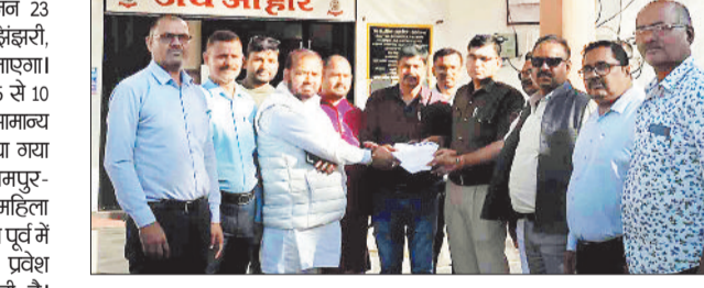
पुलिस चौकी प्रभारी को ज्ञापन सौंपते संगठन के लोग